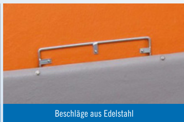
Beschläge aus Edelstahl