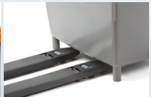
Einfacher Transport / Aufstellung