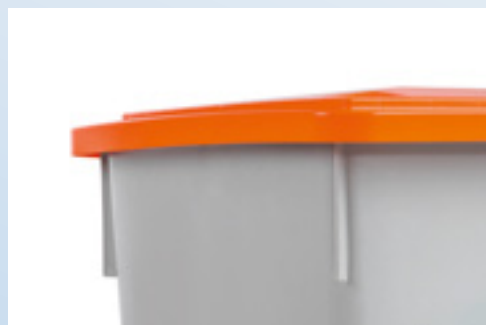
Deckel mit Rand gegen Wassereintritt