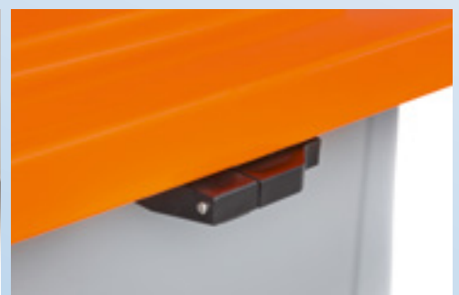
Robuste, wartungsfreie Scharniere