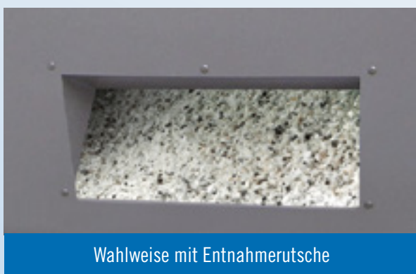
Wahlweise mit Entnahmerutsche