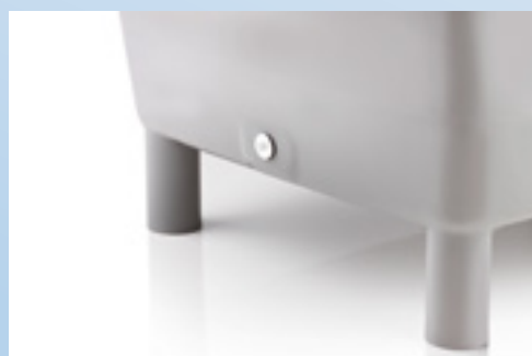
Auslauföffnung für Kondenswasser