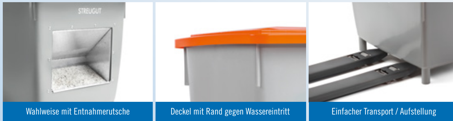
Wahlweise mit Entnahmerutsche