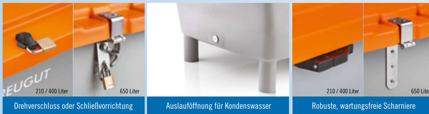
Drehverschluss oder Schließvorrichtung